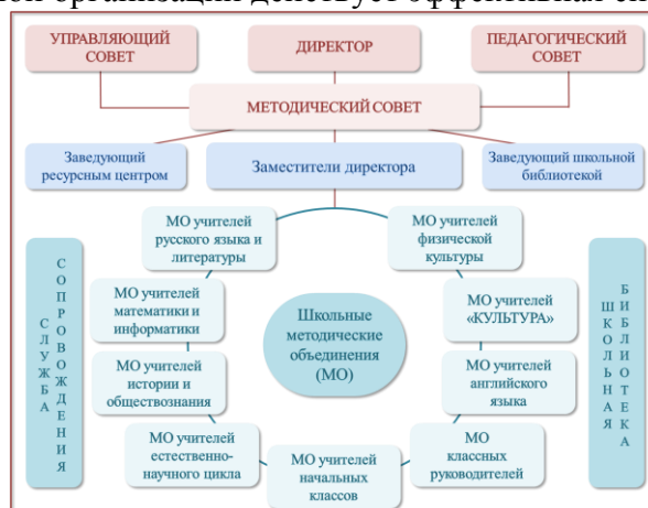
Система управления МБОУ «Федоровская СОШ №2 с углублённым изучением отдельных предметов»

В образовательной организации действует эффективная система управления